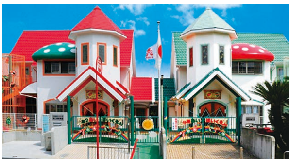
▶ アットホームな可愛い園舎

地域的には少子化傾向にあります。しかし、園長先生は「その分、子どもたち一人ひとりとていねいに関わってきたい」とおっしゃいました。 (編集委員H・I)