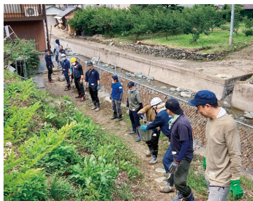
▲みんなで泥を運び出すバケツリレー

よる早期離職防止を目的 に、求職者向けの就職セミ ナー開催の準備を進めてい ます。セミナーでは、園を 選ぶうえでの留意点や就職 セミナーのチェックポイン ト、採用後の現場保育士の 生の声等を取りまとめ求 職者へ伝える予定です。