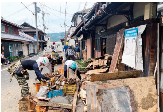
▲被災した家屋から泥や瓦礫を運び出します

当日は、31人の委員が参 加し、災害ボランティアを 運営するかつらぎ町社会福 祉協議会や他ボランティア 団体と協働で活動しました。