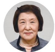
なかよよこども園 教頭